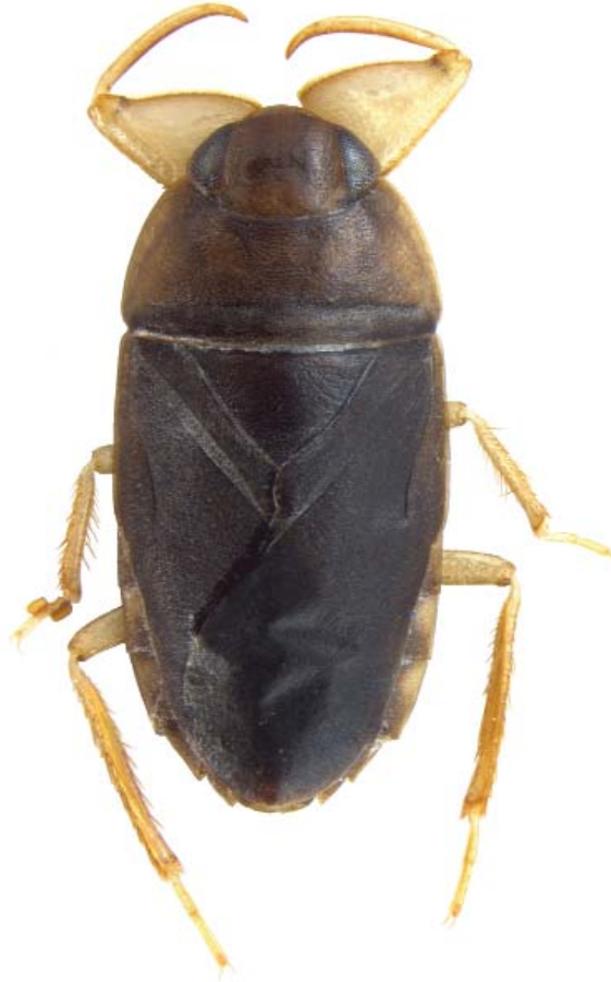
Abb. 1: Halmaheria skalei gen. et sp.n., Holotypus, makropteres Männchen, Habitus, dorsal.

Gestalt, das basal nach vorne wenig vorgezogene und daher insgesamt schlankere Profemur, das flache Mesosternum und die gegabelte linke Paramere des Männchens. Die verwandtschaftlichen Beziehungen werden in der Diskussion abgehandelt.